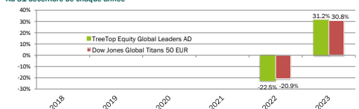
Performances annuelles de TreeTop Equity Global Leaders RDT-DBI AD EUR et de l'indice Dow Jones Global Titans 50 EUR* depuis l'origine Au 31 décembre de chaque année

Sources : CACEIS Bank, Belgium Branch et Bloomberg pour la période 2021-2024 (base 100 à l'origine : 28/01/21).